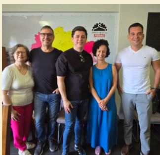
Reunião AMEM, Sindinvest, FIEMG e Hangar 24/09