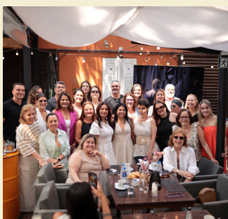
Café da manhã com consultores 03/10 Pauta: apresentação do Projeto Comprador Trend Now.