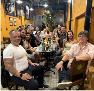
Confraternização com empresários 05/12