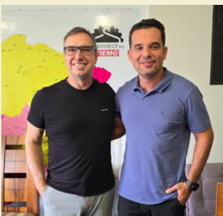
Reunião projetos 2025 17/12